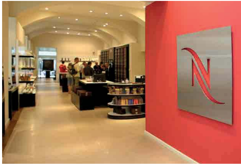
Het assortiment van Nespresso